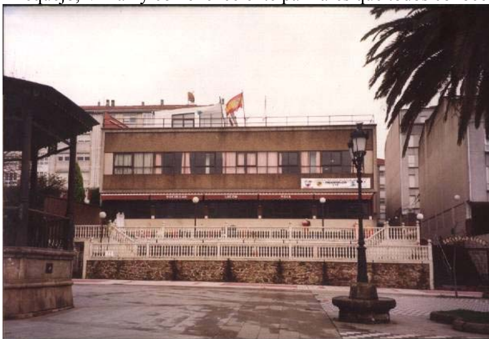
Edificio de la Sociedad Liceo de Noia