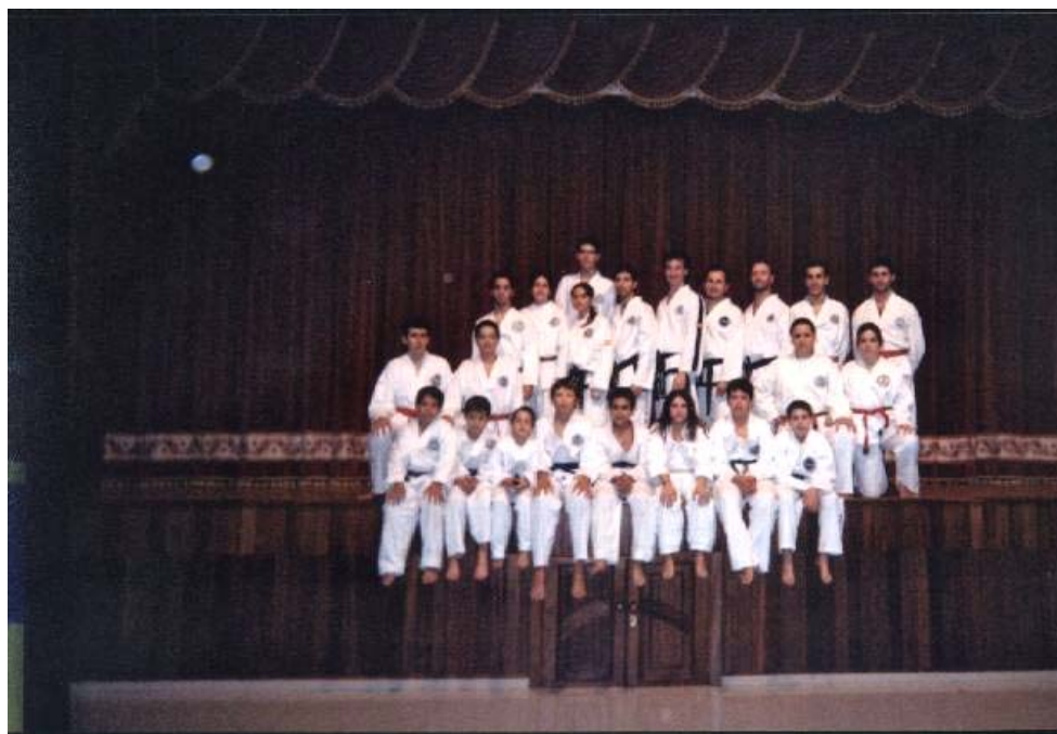
Fotografía de los asistentes al curso

La organización quedó plenamente satisfecha con el resultado de las actividades anteriormente señaladas y espera repetir experiencias similares todos los años para seguir formando a sus afiliados y a todos aquellos que quieran acudir que siempre serán bien recibidos.